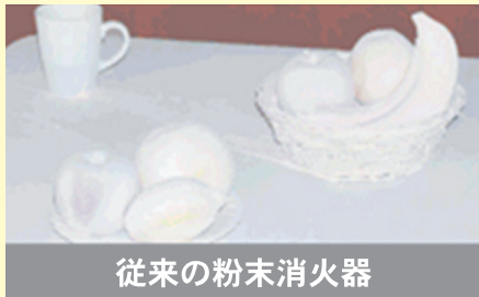
従来の粉末消火器