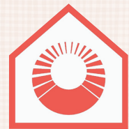
住宅防火安心マーク